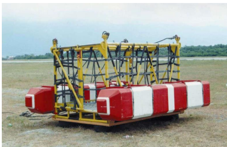
Транспортно-спасательная кабина на 20 человек с баллонетами

К месту пожара кабина ТСК-2 доставляется на прицепе автомобиля, кабина ТСК-3 - в транспортной кабине вертолета в сложенном виде.