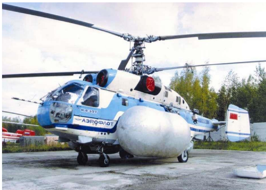
Вертолет с баллонетами

Избыточное давление воздуха в наполненном баллонете составляет 0,03-0,08 кгс/см 2 . Аварийные баллонеты удерживают вертолет на плаву при волнении моря пять баллов не менее 2 часов, и позволяют вертолету взлететь после посадки на воду.