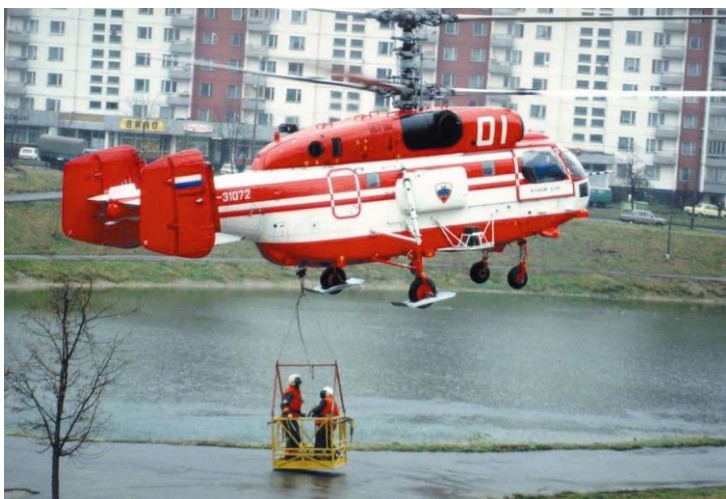
Вертолет с транспортно-спасательной кабиной на 2 человека

Для эвакуации людей с крыш, балконов или оконных проемов верхних этажей зданий предназначены транспортно-спасательные кабины ТСК-1, ТСК-2 и ТСК-3.