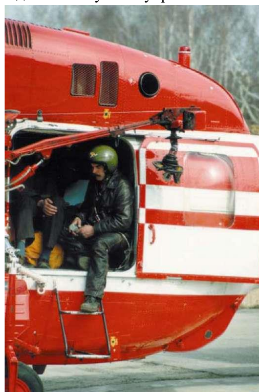
Рабочее положение оператора лебедки

Лебедка ЛПГ-300 имеет четыре скорости движения троса. К тросу лебедки могут быть подцеплены средства подъема людей: косынка подъемная, ляточное сиденье и подъемный пояс.